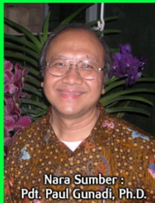
Nara Sumber : Pdt. Paul Gunadi, Ph.D.